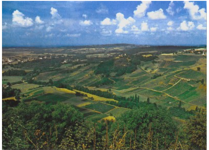
La région d'Arbois