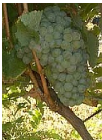
Chenin (ou Pineau de la Loire)

Et aussi : Gros plant (ou folle blanche), Romorantin (cépage unique à Cour-Cheverny)