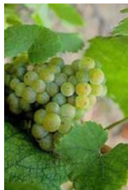
Muscadet (ou melon de bourgogne)