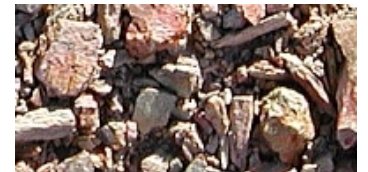
Schistes du Languedoc

Il existe différentes variétés de raisins, ce sont les cépages. Chaque cépage possède ses propres caractéristiques et c'est l'alliance du climat, du terroir et du cépage qui est un facteur de qualité. Par exemple, le pinot noir donne des fabuleux vins en Bourgogne. Ce même cépage, planté et élevé dans des conditions similaires en Californie donne des vins totalement différents qui n'ont pas la classe et l'élégance des Bourgognes.