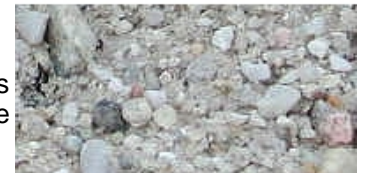
Graviers du Bordelais