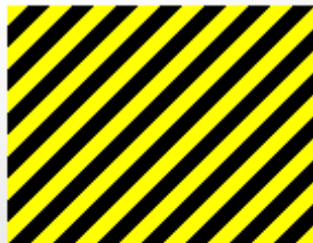
Carte à un volet

Il existe des zones d'impacts sur les cartes, c'est à dire qui attirent l'attention du lecteur en priorité, voici les principaux emplacements pour les Français :