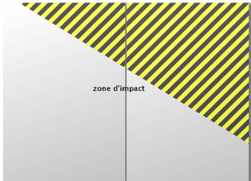
Carte à deux volets