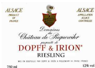
A.O.C. Alsace nom de la commune (ex : Riquewihr)