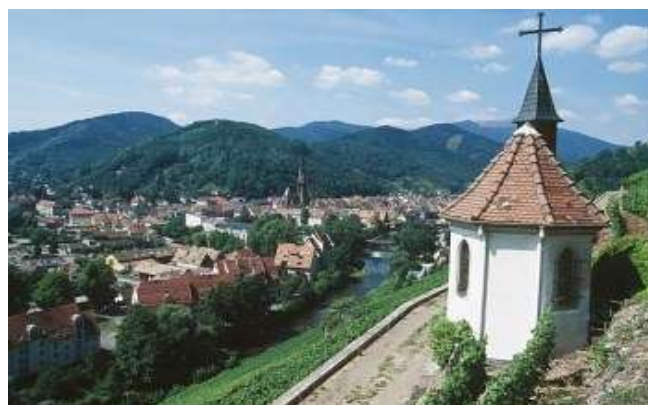
Figure2 : Thann