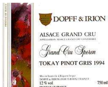
A.O.C. Alsace + Grand Cru Il s'agit d'une sélection des meilleurs vins après dégustation.