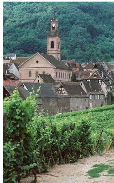
Figure 1 : Riquewihr