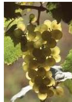
Pinot Blanc ou Klevner