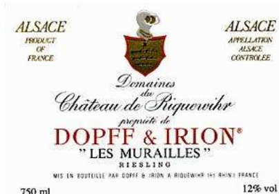
A.O.C. Alsace + lieu-dit (ex : Les murailles)