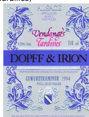
A.O.C. Alsace + Vendanges tardives (VT) Cette appellation ne s'applique que pour les cépages nobles.

A.O.C. Alsace + sélection de grains nobles (SGN) Cette appellation ne s'applique que pour les cépages nobles ramassés par tries successives.