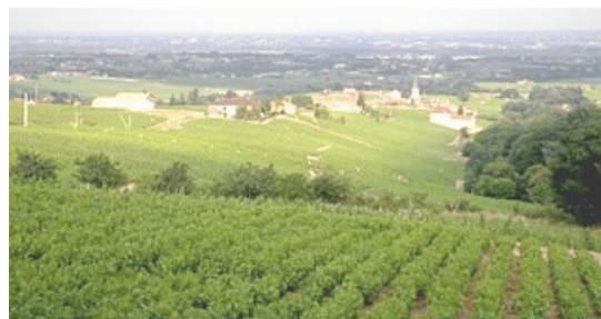
Figure 1 : Fleurie