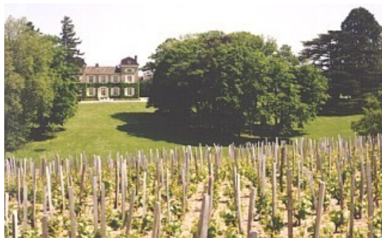
Figure2 : Chénas