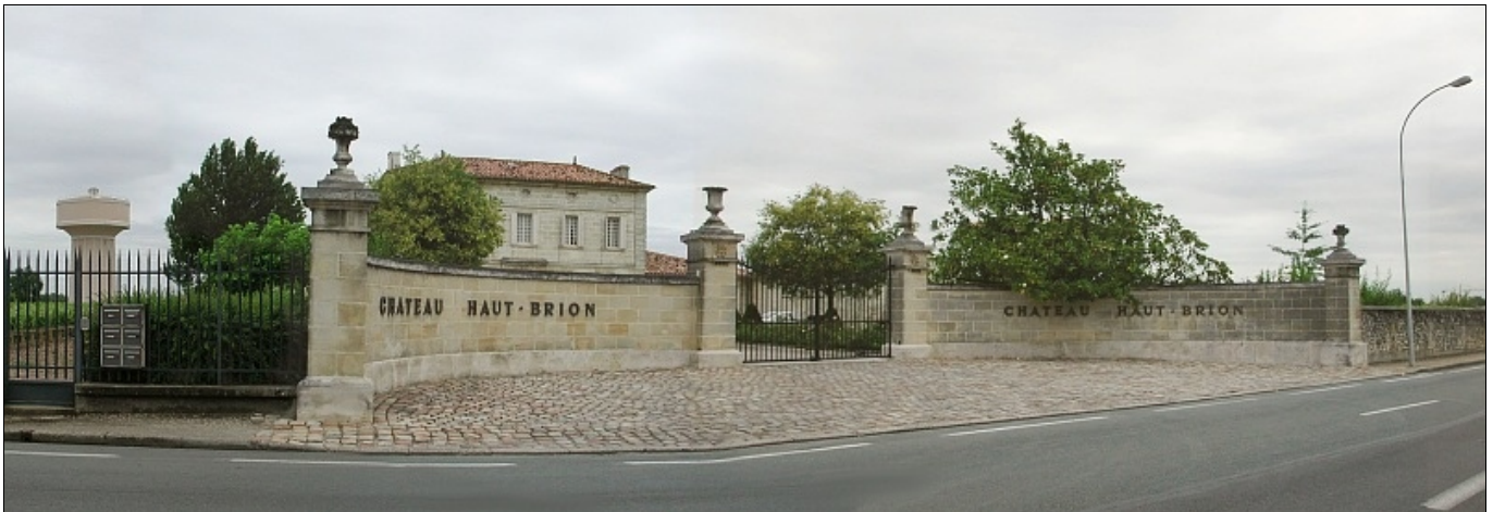
L'entrée du Château Haut-Brion à Pessac-Léognan

Il y a 208 vins classés selon 3 catégories : les Crus Exceptionnels, les Crus Grands Bourgeois et les Crus Bourgeois mais la réglementation actuelle de la CEE sur l'étiquetage n'admet cependant que la seule mention facultative de " Cru Bourgeois ".