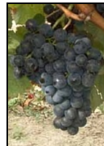
Malbec (ou côt)

Mais aussi " petit verdot " et " carmenère ".