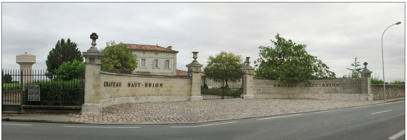
L'entrée du Château Haut-Brion à Pessac-Léognan

Il y a 208 vins classés selon 3 catégories : les Crus Exceptionnels, les Crus Grands Bourgeois et les Crus Bourgeois mais la réglementation actuelle de la CEE sur l'étiquetage n'admet cependant que la seule mention facultative de " Cru bourgeois ".