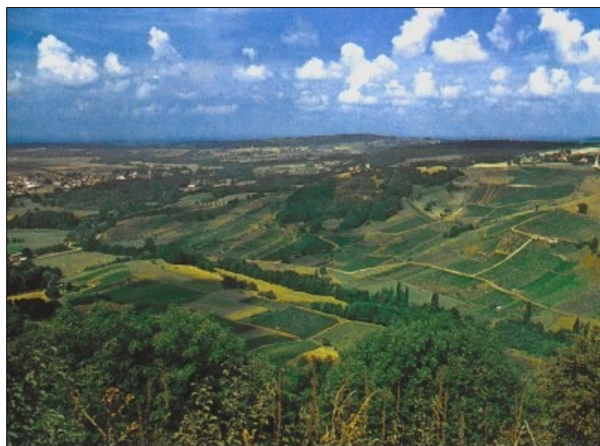
La région d'Arbois