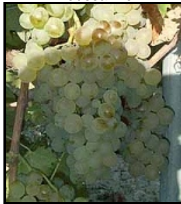
Rolle (ou vermentino blanc)