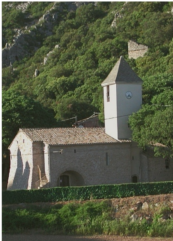
Une église dans la région de Faugères.