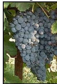
Illustration non disponible