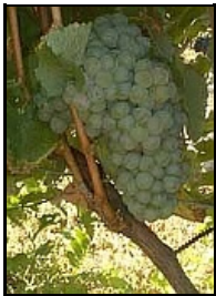
Chenin (ou Pineau de la Loire)

Blancs Et aussi : Gros plant (ou folle blanche), Romorantin (cépage unique à Cour-Cheverny)